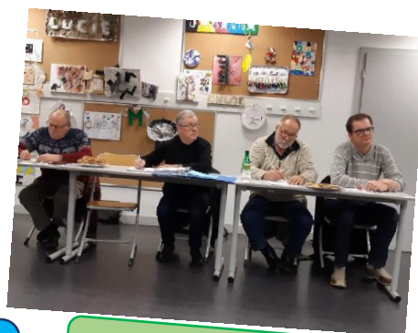
Réunion plénière du CDD. 12 décembre 2019