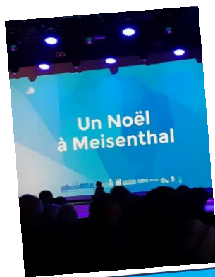
Inauguration de la boule de Noël de Meisenthal. 7 novembre 2019