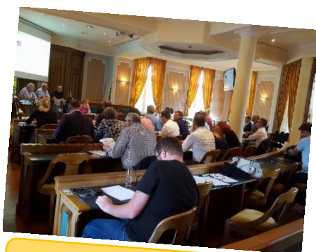
SCoT et Aménagement commercial. Copil local du 17 juin 2019