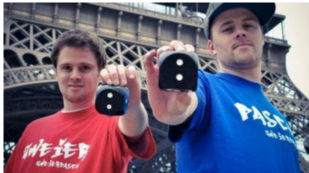
Zweierpasch ou Double deux et le rap qui rapproche les jeunes Français et Allemands

Le clip "Grenzgänger/Frontalier" du groupe de hip-hop Zweierpasch offre un bel exemple de production vivante qui stimule l'envie d'apprendre l'allemand.