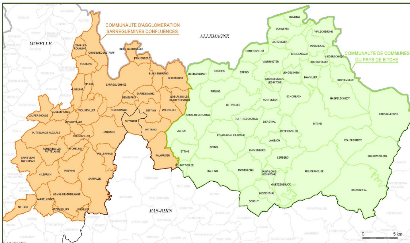
Le Pays de l’Arrondissement de Sarreguemines (au 1 er janvier 2017)

Le Syndicat Mixte de l’Arrondissement de Sarreguemines (SMAS) est la structure porteuse du Pays de l’Arrondissement de Sarreguemines. Dans ce cadre et depuis 2002, le SMAS soutient l’animation du Conseil de développement du Pays, regroupant des représentants de la société civile. Le format du Conseil de développement a été revu en 2017 : d’une centaine de membres comptant des élus intercommunaux, il est passé à une trentaine de membres sans élu politique.